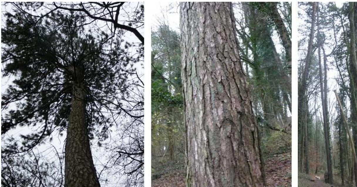
Les pins laricio du Saint Quentin