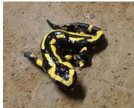
Salamandre tachetée (Plappeville, 06/03/2018)