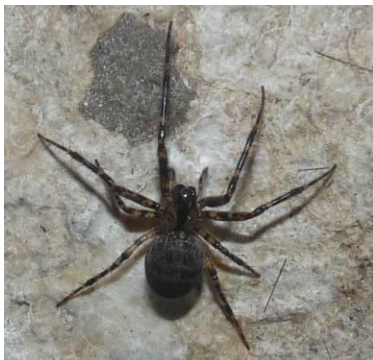
Metellina merianae