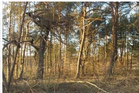
Partie de boisement préservé