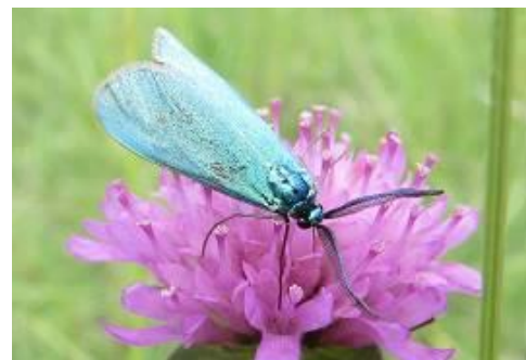
Jordanita sp (la turquoise)