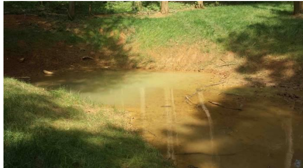
La mare de Lessy en été (Photo MR : 22/07/2018)

- Mare de Lessy : il y a toujours eu un peu d'eau en 2018, malgré la sécheresse estivale, tout comme en ce début d'année (constat du 14/01/2019). Un problème d'étanchéité l'empêche de se remplir.