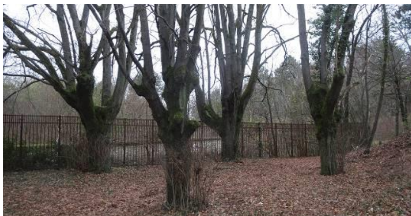
Les quatre tilleuls des sorcières (Photo GL 30/11/2018)

- Datation des « quatre tilleuls de l'emplacement de la Croix Cueillat », près du Fort de Plappeville : MR avec l'aide de GL voudrait trouver un moyen de les dater pour savoir s'ils sont vraiment antérieurs à la date de la construction du fort (1867).