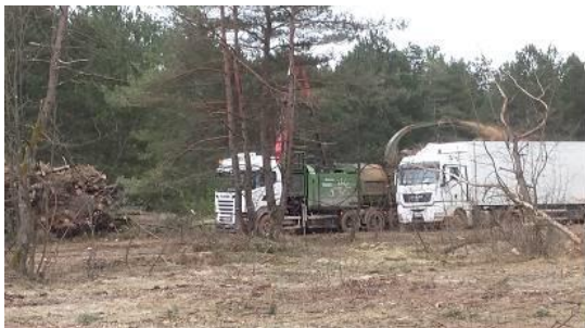
Le broyeur en action

- Le nouveau réseau Biodiversité va être lancé fin 2018. Objectifs : * privilégier les échanges entre communes sur divers projets ; * partager les expériences et recenser les besoins/projets de chacun ; * se baser sur l'expérience Natura 2000 et celle des commune de MM pour accompagner les porteurs de projets s'ils le souhaitent.