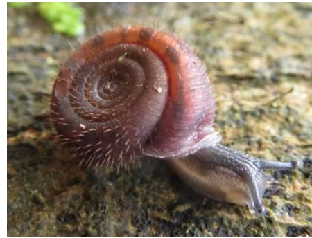
Helicodonta obvoluta 2018

Nous entendons des chants et trouvons des indices de présence d'oiseaux divers et découvrons Phosphuga atrata , un coléoptère mangeur de petits escargots. Vers le retour, deux Citrons ( Gonopteryx rhamni ) volètent dans l'allée, et observation d'une belle cépée d'Erable sycomore ( Acer pseudoplatanus ) à 33 tiges !