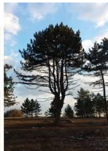
Un pin remarquable Photos MR (mars 2018)