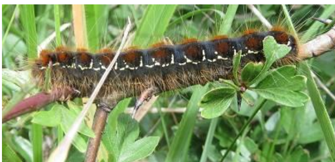
Eriogaster lanestris (le bombyx laineux)