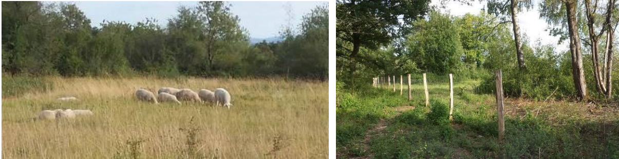
Moutons au Saint-Quentin et mise en place de la clôture